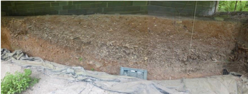
Coupe frontale des dépôts du Mésolithique ancien et récent surmontant à l'Est ceux du Magdalénien moyen (à lamelles scalènes et antilope Saïga).