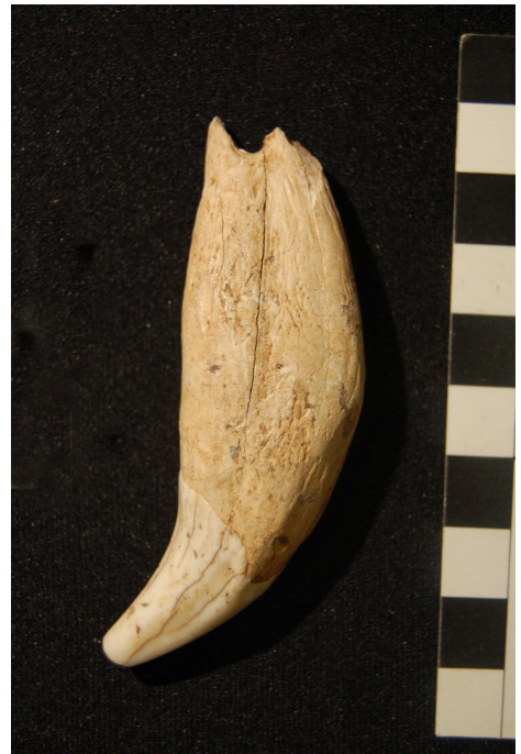
Canine d'ours perforée

Document scientifique établi par Edmée Ladier en date du 12/10/2024