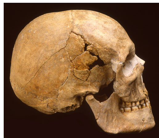
Le même, restauré