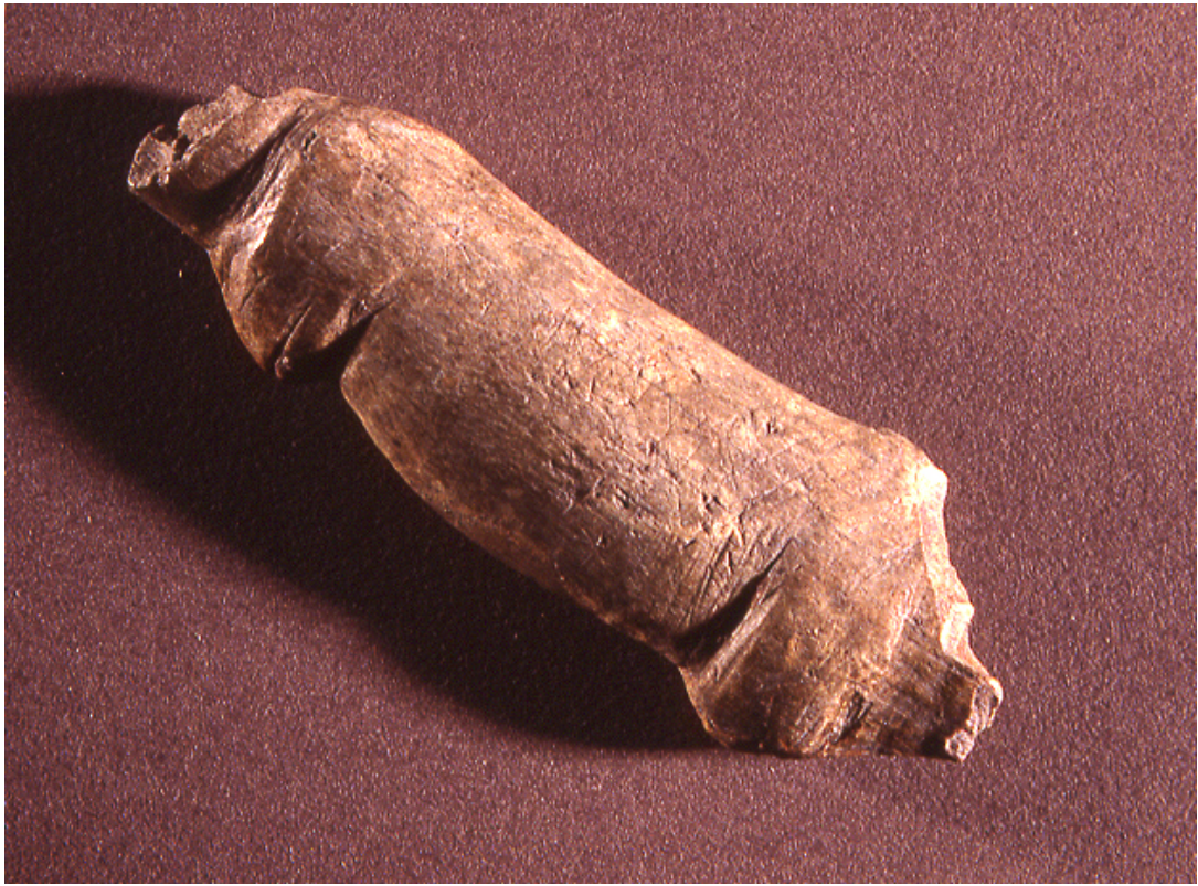
Animal en ronde-bosse