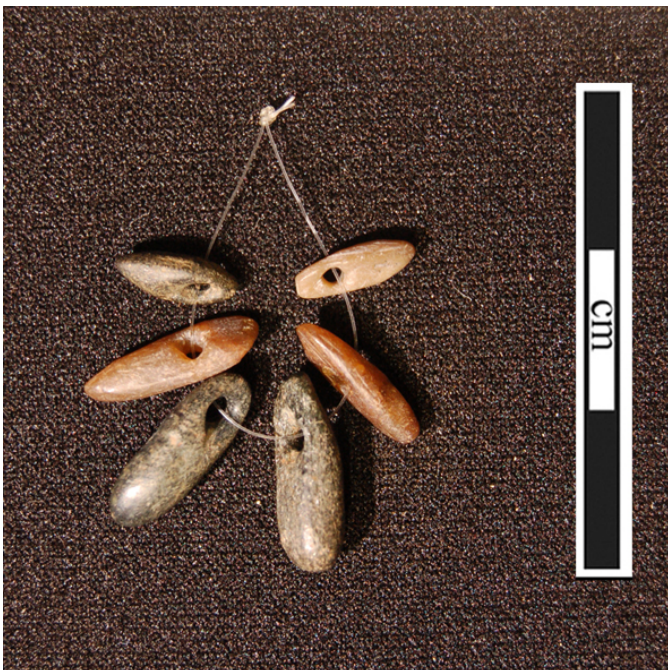
Perles en stéatite