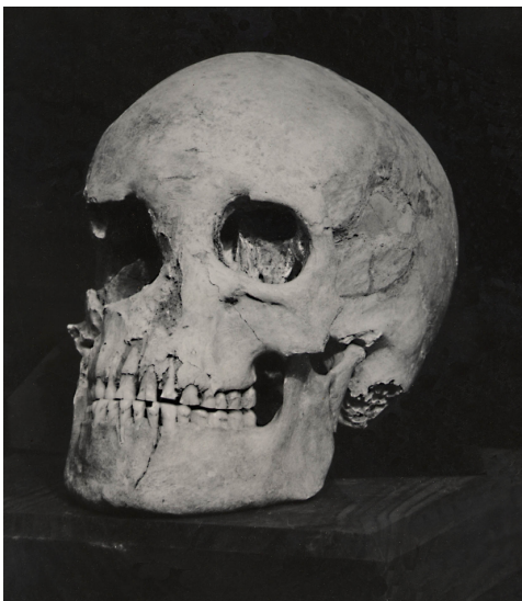
Le crâne de la femme, état d'origine

De nombreux outils et instruments en silex et en bois de renne ont été découverts dans l'abri Lafaye, ainsi que des armes pour la chasse. Les objets en bois de renne sont souvent décorés de motifs géométriques ou animaliers. On y reconnaît en particulier des chevaux, un félin et un aurochs.