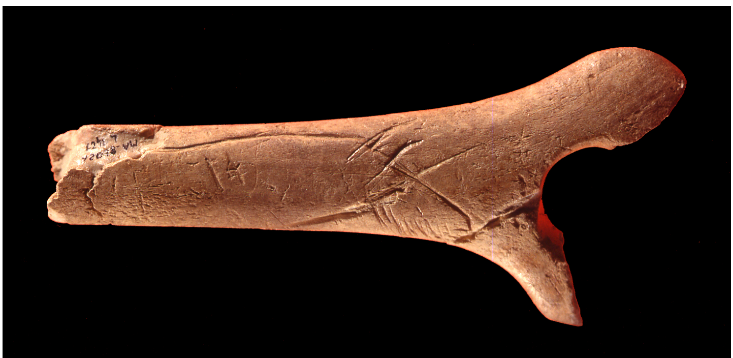
2 Bâtons percés gravés