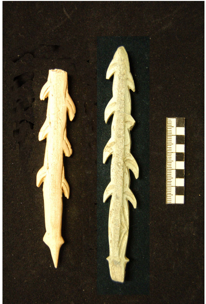
Harpons à un et deux rangs de barbelures